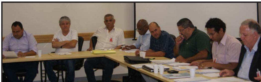
Diretores do Sindicato reunidos