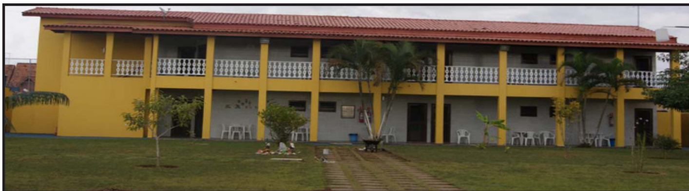
A Colônia dos Gráficos, em Caraguatatuba, proporciona laser, diversão, e clima perfeito para o merecido descanso após mais um ano de muito trabalho

Mais informações pelo telefone 2443-1294 / 2463-2076