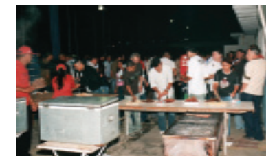
Festa de comemoração