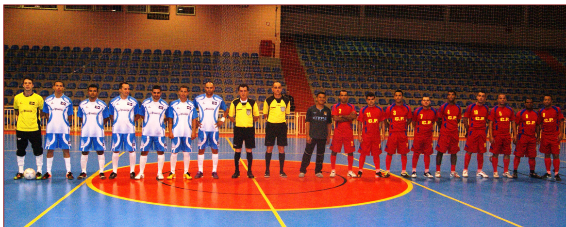
Em 2013 o time da Converplast (vermelho) avançou até a final e foi campeão após vencer a partida nos pênaltis

de Campos, a edição deste ano tende a ser bem disputada. "Os times entram sempre para vencer, mas acima de tudo o Campeonato é um momento de lazer e integração entre os Trabalhadores e o Sindicato. Por este motivo vamos estar atentos a disciplina. Acredito que todos serão leais e teremos jogos limpos, mas caso haja violência os responsáveis serão punidos", diz Newton.