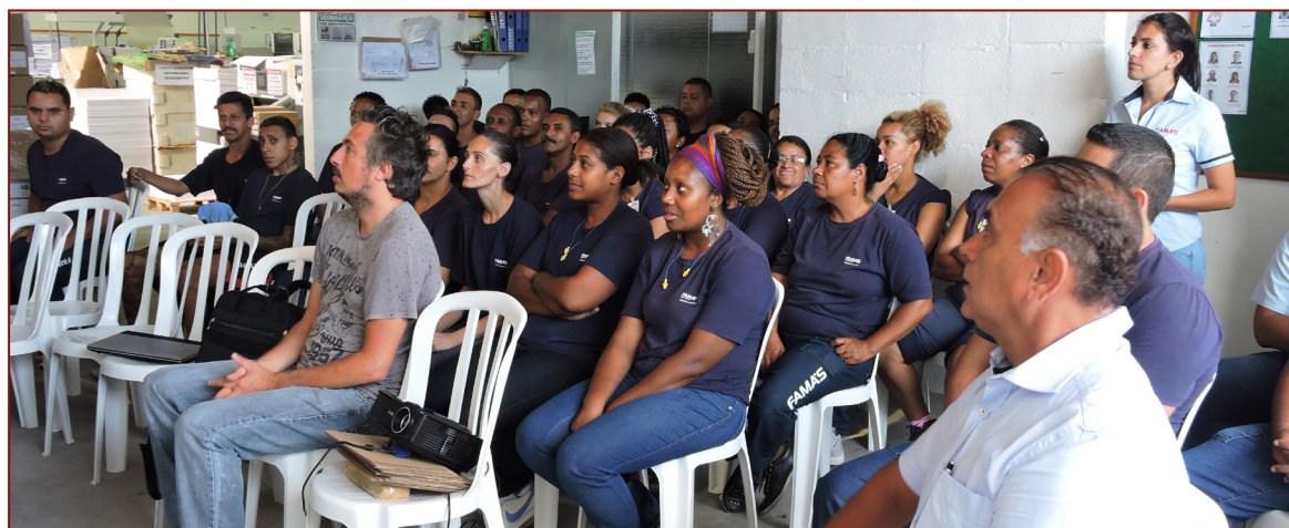
Sindicato visitou recentemente a Gráfica e Editora JC - Fama; em palestra foi citada a importância da sindicalização

Além de fortalecer a categoria para as lutas trabalhis-