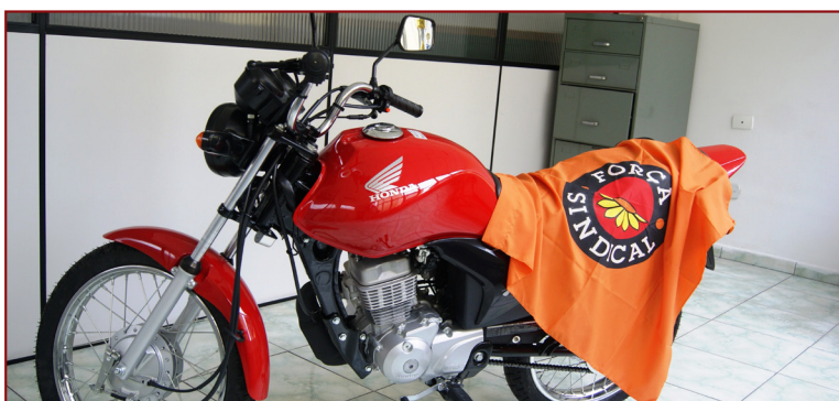
A Campanha de Sindicalização irá sortear uma Moto Zero KM e uma TV de 40 polegadas entre Trabalhadores Associados