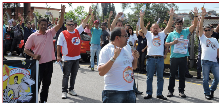
Sindicalizado o Trabalhador tem mais representatividade e participa diretamente das lutas por melhorias