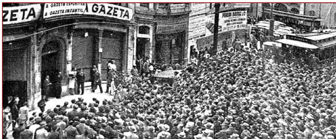
Greve organizada pelos Gráficos em 07 de fevereiro de 1923 é um marco na luta pelos direitos trabalhistas

Por lidar com a impressão de livros, jornais e demais documentos importantes, sempre exigiu-se dos Gráficos uma melhor formação,