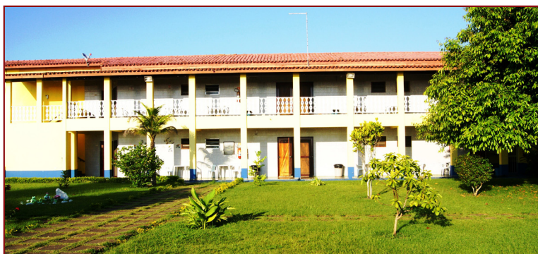
Colônia de Férias à disposição dos Trabalhadores Associados, lugar ideal para o descanso e lazer em família