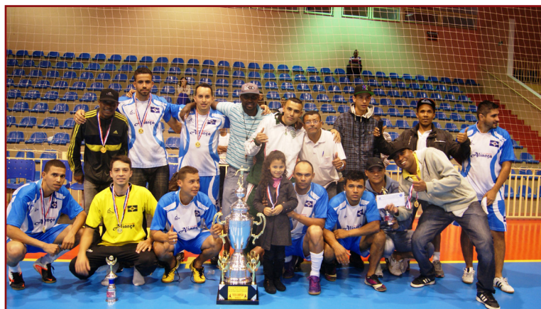
O time Folhinhas Aliança jogou bem e ficou com o vice-campeonato em 2013

de Campos, a edição deste ano tende a ser bem disputada. "Os times entram sempre para vencer, mas acima de tudo o Campeonato é um momento de lazer e integração entre os Trabalhadores e o Sindicato. Por este motivo vamos estar atentos a disciplina. Acredito que todos serão leais e teremos jogos limpos, mas caso haja violência os responsáveis serão punidos", diz Newton.