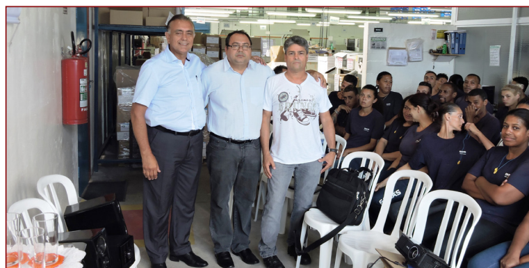
Trabalhadores, Sindicato e empresa estiveram unidos durante a palestra

tas os associados têm direito a diversos benefícios, entre eles Colônia de Férias, Convênio com Dentista, Salão de Festas, Assistência Jurídica, Cursos de Inglês e Informática e desconto nas melhores universidades de Guarulhos e Região. Os associados participam também do Campeonato de Futsal e Festa das Crianças, eventos organizados pelo Sindicato.